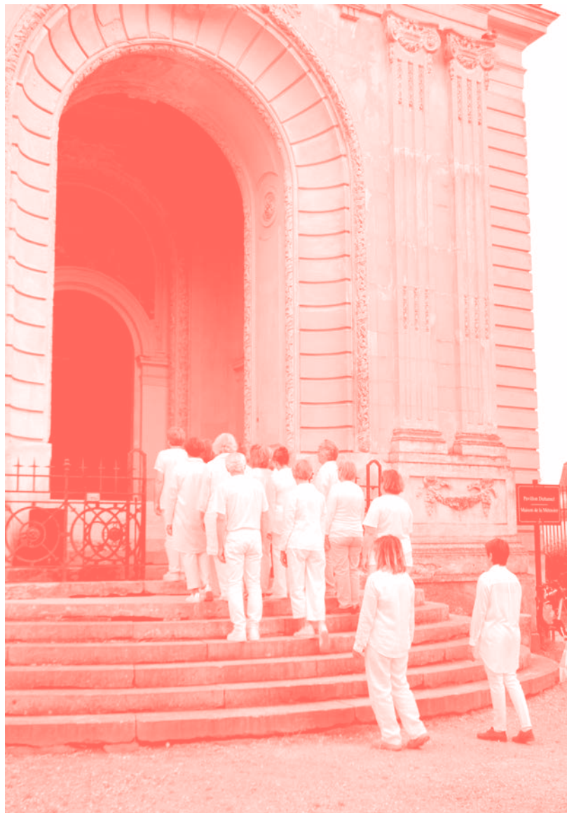
La Procession, compagnie Nacera Belaza au pavillon Duhamel (Mantes-la-Jolie), juin 2017.